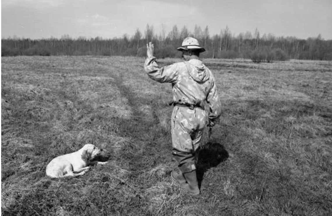
Перед посылкой собаки в поиск ее укладывают командой "Даун". Для обучения поиску челноком лучше всего подходят открытые влажные луга с кочкарником

Подходим к полю где нет или очень мало охотничьей птицы, собака по команде идет рядом. Заходим в поле на ветер. Укладываем собаку командой "Даун" и отходим от нее на 5 метров вправо или влево поперек направления ветра и стоим лицом к ветру.