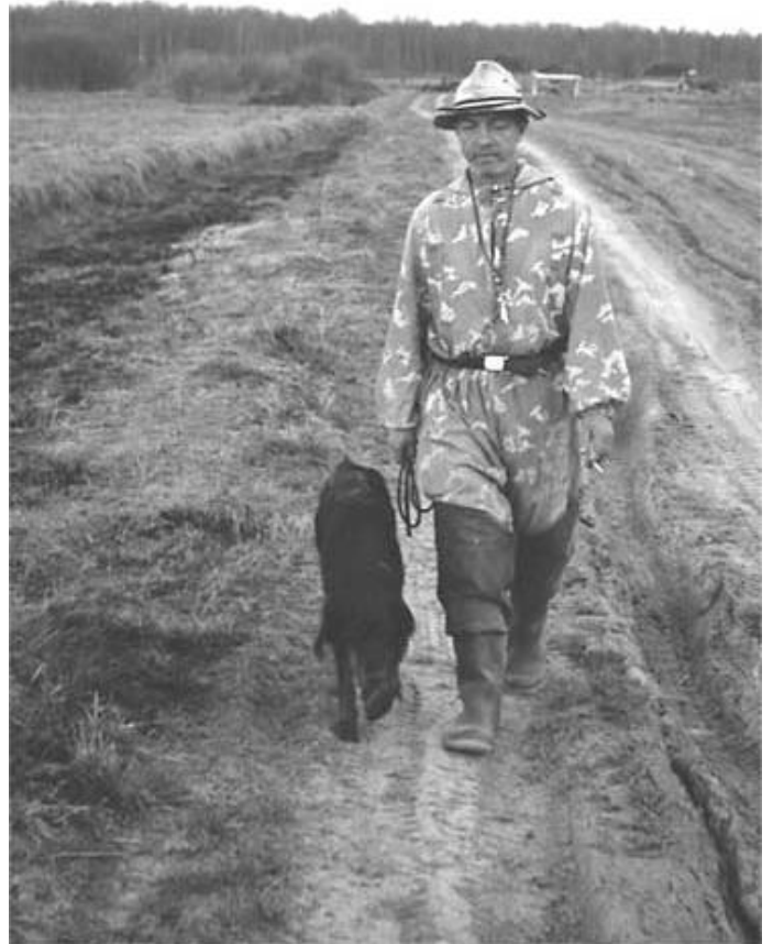
Заходим на поле по команде "Рядом"