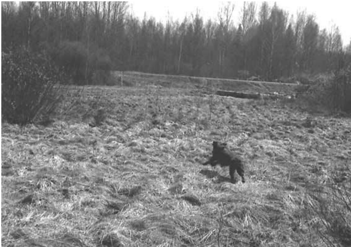
По команде "Вперед" собака совершает бросок в сторону птицы, вынуждая ее взлететь. Это называется подачей птицы под выстрел

Когда взлетела птица, собаке желательно видеть вылетающую птицу. Вы же должны увидеть и запомнить, куда она переместилась, а также следить за поведением собаки - собака должна оставаться на месте. Обычно птица, если не улетает совсем далеко, то садится метров за 50-200 от того места, откуда вылетела.