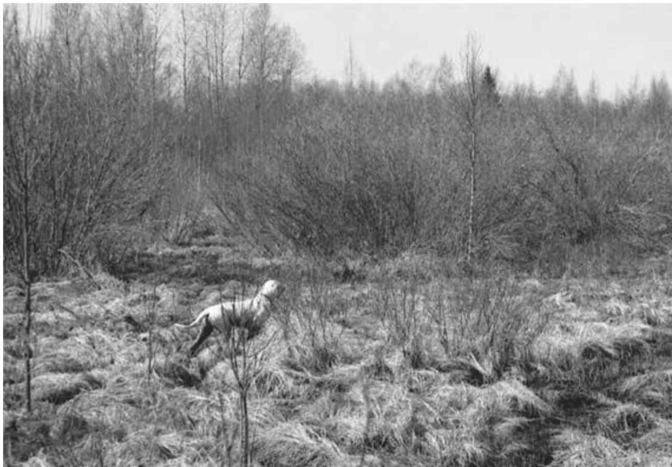
Первая стойка, еще неуверенная

Верьте собаке, когда она потянула, напряглась, вытянулась и встала с высоко поднятой головой. Подходите к собаке, негромко, но уверенно, повторяя команду "Стоять", удерживая ее от броска на птицу. Корду возьмите крепко в руку, одетую в перчатку. Перчатка особенно важна при натаске крепких, мощных собак - гордонов, дратхааров, которые могут рвануть и, если вы держите корду голой рукой, то содрать или сжечь кожу на ладони.