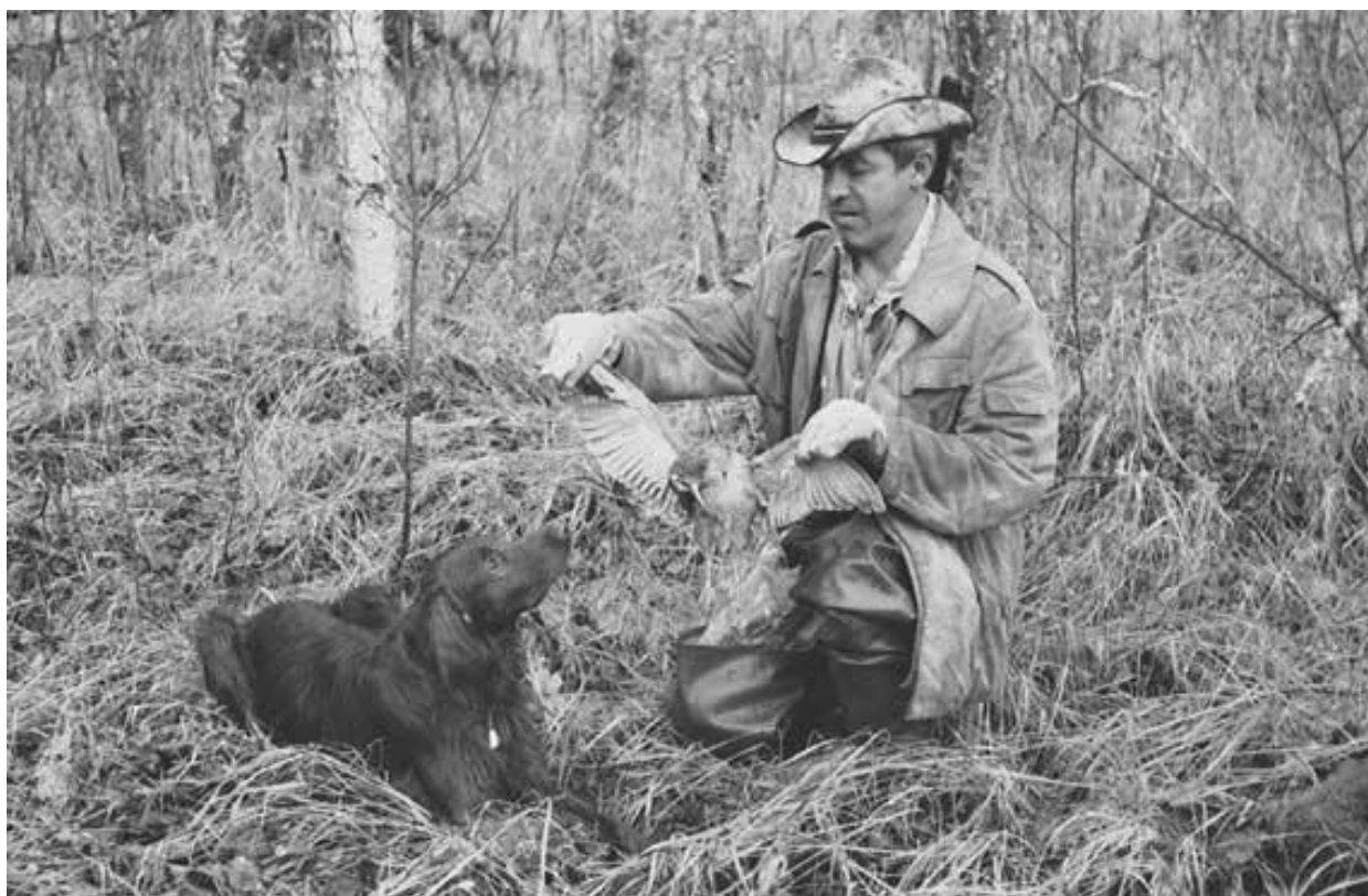
Молодой собаке показывают и дают обнюхать вальдинепа

Вдруг собака тормознулась и потянула. Вы все внимание на собаку. Тянет, тянет 10-15 метров. Встала. Птица не боится собаки, если та на нее не напирает. А вот вас птица слышит. Подходить к собаке нужно так. Сначала нужно пробежаться и за десять метров до собаки перейти на аккуратный шаг и подойти к собаке сзади несколько сбоку, так как нельзя стрелять прямо над головой собаки. При выстреле создается сильнейшее давление воздуха, что может напугать собаку, и она будет бояться выстрела. Значит, птица продвинулась и затаилась. Посылаете собаку вперед. Взлет. Для собаки со слабой нервной системой достаточно крикнуть: "Стоять!" и отпустить птицу, чтобы она отлетела метров на 15 - 20, стреляем и - мимо! Собаку подзываем к себе. Еще несколько таких промахов и вы можете испортить собаку. У собаки возникнет стойкая боязнь выстрела.