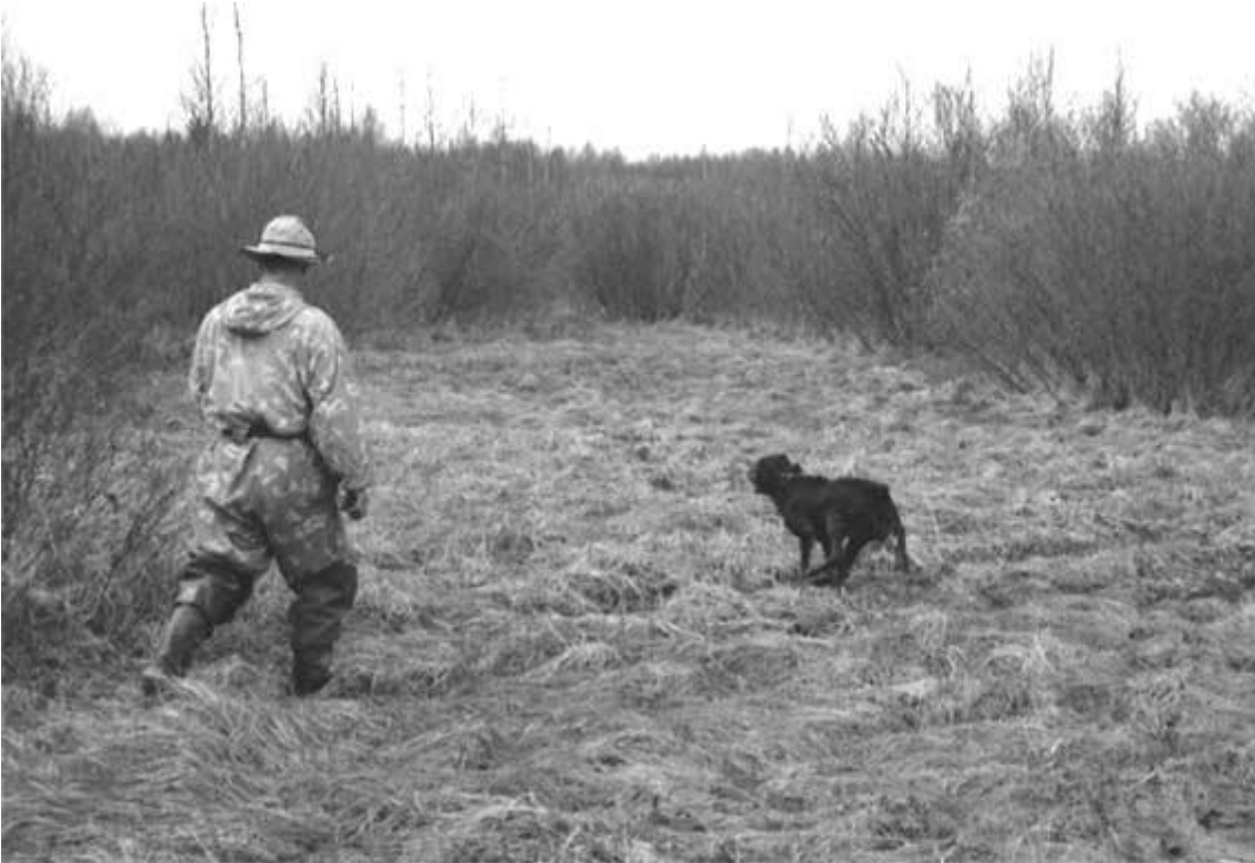
Собака твердо стоит в стойке. Ведущий быстро подходит к собаке. За 2-5 метров от собаки ведущий останавливается и подает команду "Вперед"