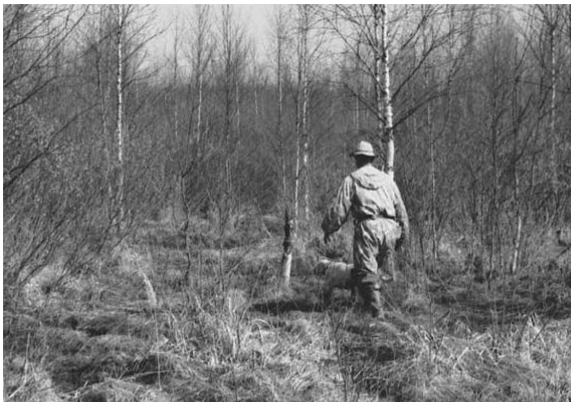
Собака встала в стойку, ведущий подходит к ней, приговаривая "Стоять, стоять", помогая собаке удерживаться в стойке

Итак, подойдите к собаке вплотную, выдержите несколько секунд, скомандуйте "рядом" и двигайтесь вместе с ней по направлению, куда указывает голова собаки - это применяется к напористым, страстным собакам. Собакам робким и изнеженным дается команда "Вперед", при взлете птицы - команда "Стоять" и подзываем свистом к себе. Если птица не отбежала, то она вылетит - дупель или бекас - прямо по направлению движения собаки. Если отбежала, то может вылететь несколько в стороне.