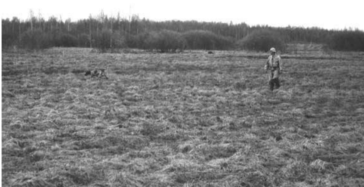
Собака бежала впереди ведущего по параллели и, замедлив бег, перешла на потяжку

Верьте собаке, когда она потянула, напряглась, вытянулась и встала с высоко поднятой головой. Подходите к собаке, негромко, но уверенно, повторяя команду "Стоять", удерживая ее от броска на птицу. Корду возьмите крепко в руку, одетую в перчатку. Перчатка особенно важна при натаске крепких, мощных собак - гордонов, дратхааров, которые могут рвануть и, если вы держите корду голой рукой, то содрать или сжечь кожу на ладони.